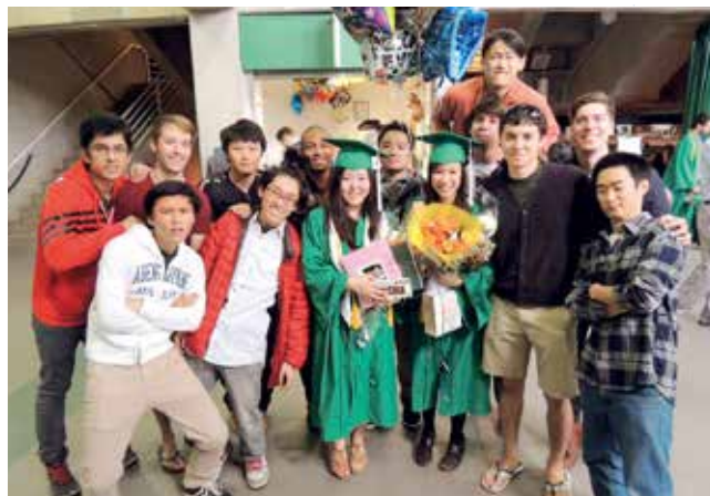
ミシガン州立大学の卒業式

進学した大学では、日本語と英文学を専攻しました。学内では、世界中から来た留学生と外国の文化を紹介するイベントを開くなど、活発に活動していました。仲のいい友達とヒップホップのサークルをつくり、ダンスも楽