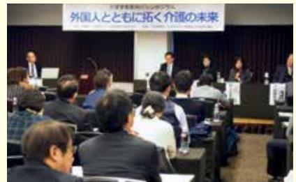
パネルディスカッションの様子 (2017年11月22日(水)、TKP ガーデンシティ仙台)。

また、県内の介護福祉施設への出張説明会も実施し、昨年12月から今年3月までの間に8つの施設等に出向きました。施設管理者から現場スタッフまで多くの方々からたくさんのご質問があり、関心の高さがうかがわれました。