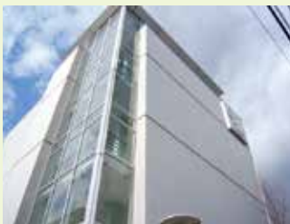
同和興業株式会社 BMセンター

当社は1961年の設立以来、地元ビルメンテナンスのリーディングカンパニーとして、保守管理はもちろんのこと、警備業務も含め、安全で快適な環境づくりに取り組んでまいりました。経営理念としては、「今日の充実で、明日に拓ける」と「相互信頼」の精神に基づき、顧客の「信頼と満足」を得て、建築物環境保全に最大限の努力をすることと、人にやさしい環境を創造し、地域社会とともに地球環境に大きく貢献することを掲げています。お客様に安心して当社のサービスを受けていただけるよう、1999年には国際標準化機構(ISO)の品質マネジメントシステムに関する規格「ISO9001」の認証も取得しています。