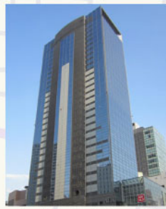
ガーデンシティ仙台 (AER 内)

※お車でお越しの際は、 契約駐車場等はありませんのでAERビル地下駐 車場もしくは近隣の民間 駐車場をご利用ください ませ。